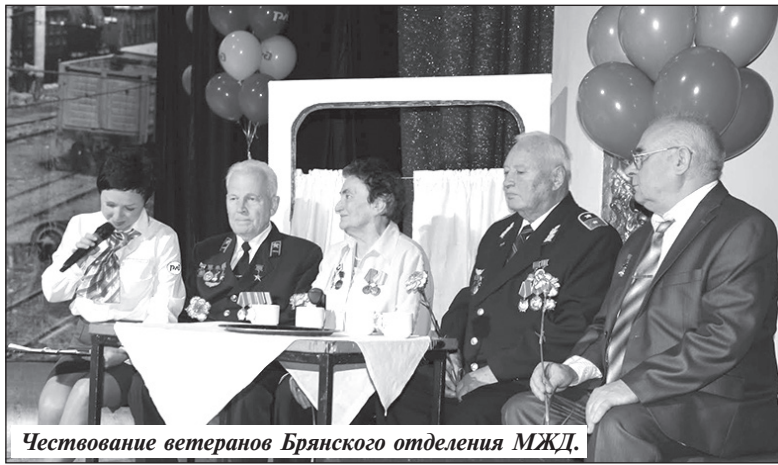
Чествование ветеранов Брянского отделения МЖД.

Свой путь Брянское отделение дороги начало 70 лет назад, когда приказом Министерства путей сообщения № 787 от 3 октября